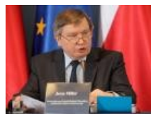
Prezentacja raportu Millera