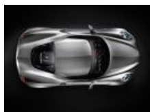
Nowa Alfa Romeo! Nie z tej ziemi