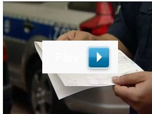
"Wydarzenia" Polsatu/ Przedsiębiorcy na celowniku oszustów