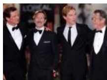
Szpiedzy Oldman i Firth na premierze w Wenecji