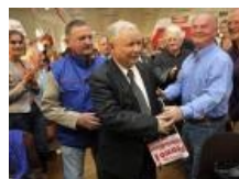
Kaczyński w Stoczni Gdańskiej