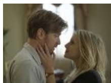
Ewan McGregor życiowym debiutantem