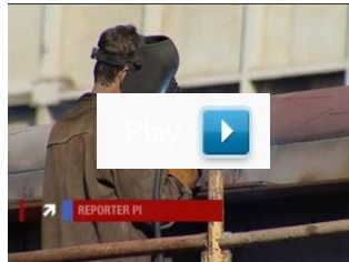
"Wydarzenia" Polsatu/ Polscy stocznicy wolą zagranicę