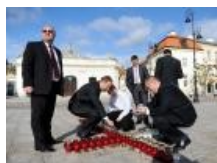
Wieńce i znicze przed Pałacem Prezydenckim