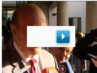
"Wydarzenia" Polsatu/ Ministrowie finansów spotkali się we Wrocławiu