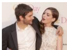
Anne Hathaway z Jimem Sturgessem – gwiazdy