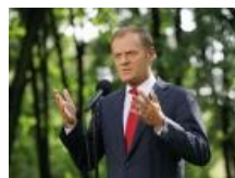
Awantura o debaty wyborcze