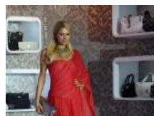
Kontrowersyjna celebrytka została