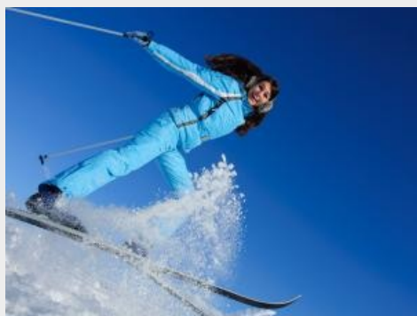
Firmy wysyłają pracowników na narty

Tagi: PRACOWNICY , nagroda , pracodawca , premia