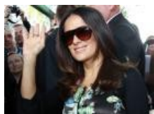
Salma Hayek i Antonio Banderas w Polsce!