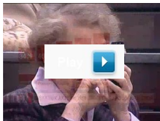
"Wydarzenia" Polsatu/ Trzeci wiek - złoty wiek!