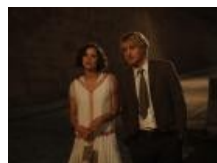
O północy w Paryżu z Woody Allenem