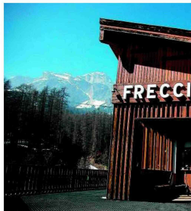
Na drugim miejscu są Włochy